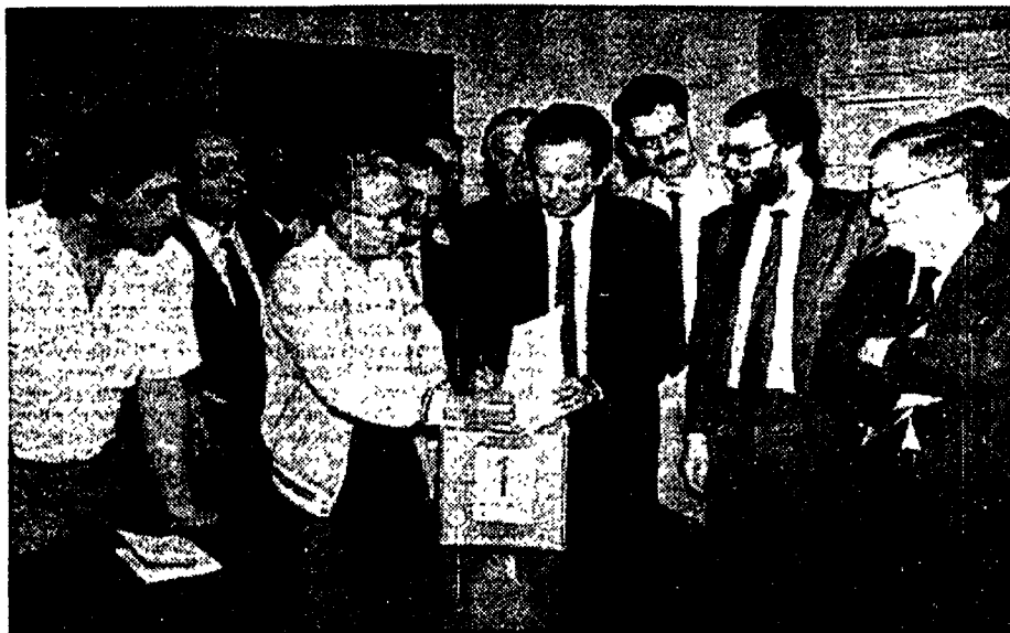
Consegnati ieri alla Corte di Cassazione delle firme raccolte per i referendum istituzionali

608 mila firme per il referendum sulla legge elettorale del Senato, 605 mila per gli altri due.